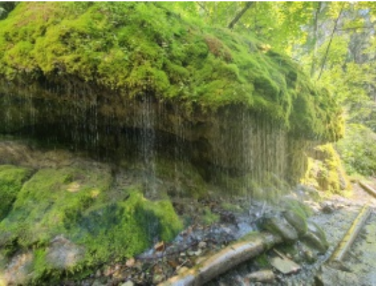
Viel Wasser in der Wutachschlucht

hatte. Also trotz nicht so hoher Temperaturen reingehüpft! Am nächsten Tag dann auf den zweiten Feldberg mit schöner Fernsicht und mein Abschied vom Westweg. Über den Schluchsee ging es zur Wutachschlucht. Imposant zieht sie sich wildromantisch durchs Tal, und wenn die einzige Wasserauffüllmöglichkeit unangekündigt geschlossen hat, wird