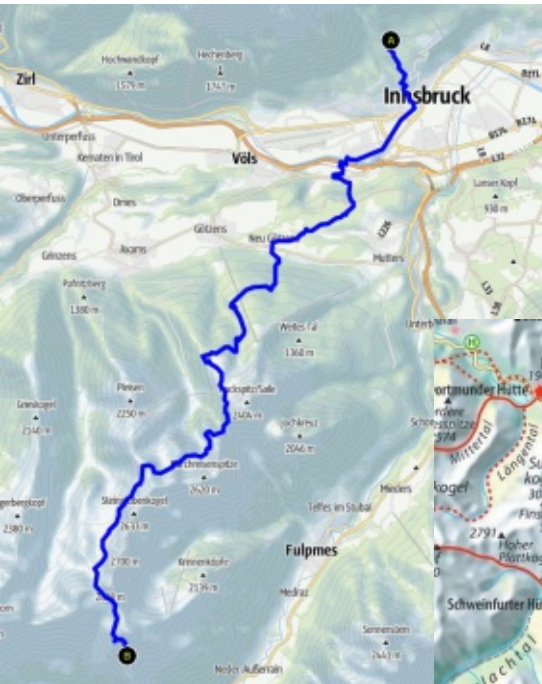
Tour 1: Innsbruck - Westfalenhaus

Dort ist auch beschrieben, ab wann und wie man sich zu den Touren anmelden kann.