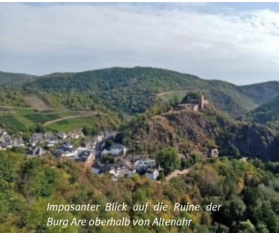
Imposanter Blick auf die Ruine der Burg Are oberhalb von Altenahr

Weiter ging es durch lichten Forst und über Wiesenwege zu unserem Tagesziel Aremberg. Ein malerischer Eifelort 520 ü.NN mit phantastischen Ausblicken über das obere Ahrtal. Wir übernachteten in der Burgschänke, ein historisches Gasthaus mit freundlichem Ambiente. Auf der Terrasse genossen wir bei köstlichem Pinot Noire von der Ahr den ausklingenden Tag.