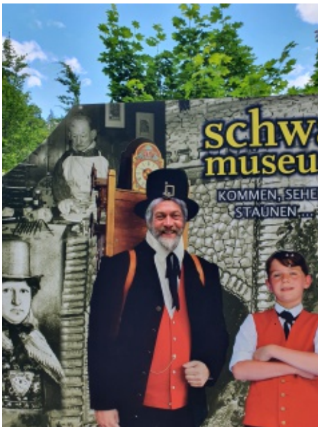
Touri-Tag in Triberg

nisreiche Reise waren zu Ende, und mit der Bahn ging's nach zwei Chill-Tagen wieder heimwärts. Ich bin wirklich dankbar, dass ich so viel Zeit hatte und diese Tour so erleben konnte.