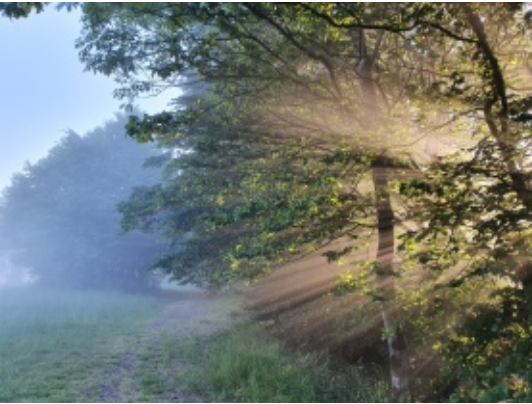
Lichtspiele auf der Hoheley

Wald quasi voll. Der Westweg ist wohl DER Prestige-Wanderweg in Deutschland, und an einem langen Wochenende mit gutem Wetter war der E1 gut bewandert. An einer Schutzhütte haben wir mit 11 (!) Personen geschlafen. Und auch die umliegenden Hütten waren voll. Ganz anders als zum Beispiel hier in der Egge, wo man mittlerweile fast niemanden mehr trifft, war hier auf dem Westweg die gesamte Palette von Wanderer-Varianten zu finden. Ultraleicht mit minimalistischem Zelt, mit riesengroßem Rucksack und allem, was der Outdoorhändler so zu bieten hat, bis hin zu Wanderern, die in Hotels schlafen und ihr Gepäck per Shuttle transportieren lassen.