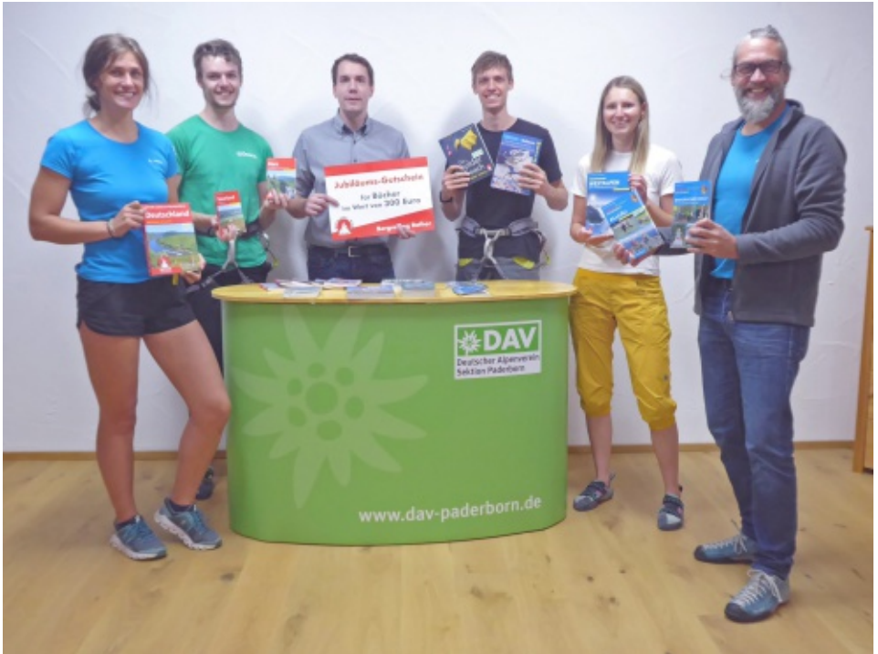
Das frische Material für unsere Bibliothek stößt auf großes Interesse.