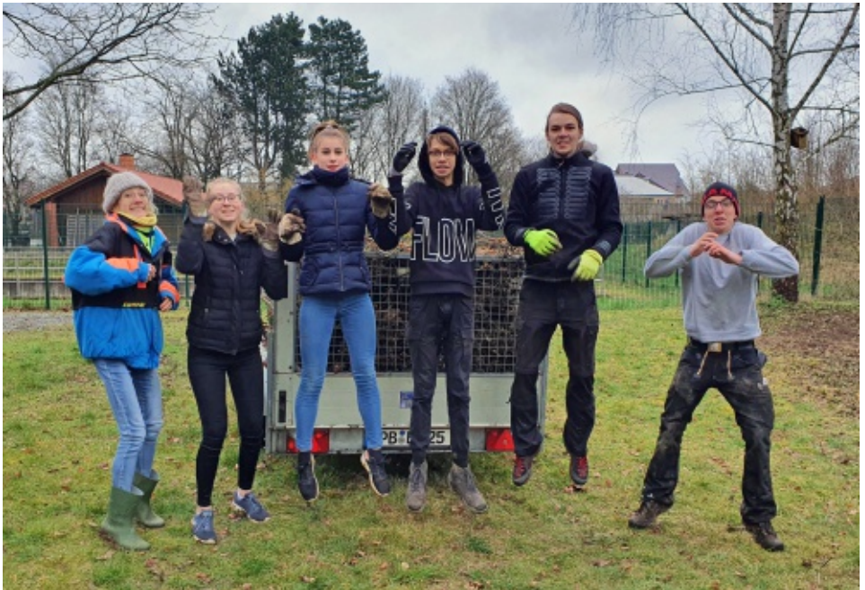
Geschafft! Anhänger ist voll!