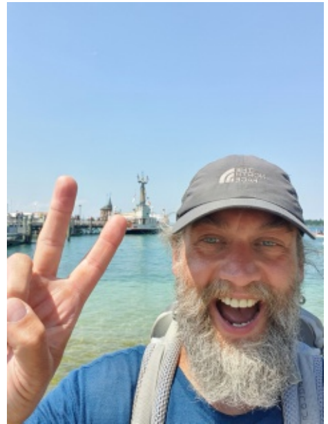
Am Ziel in Konstanz

Nach 41 Tagen und 840 Km erreichte ich Konstanz. Eine tolle Wanderung und eine erleb-