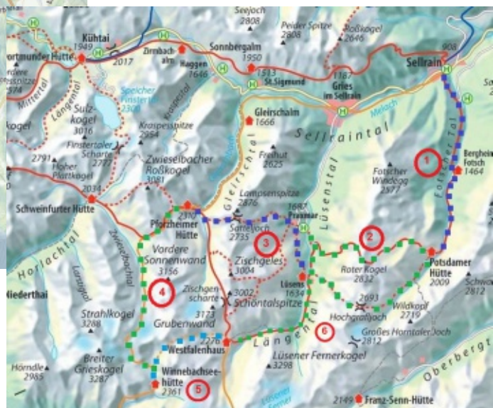
Tour 2: Dorf Sellrain - Westfalenhaus