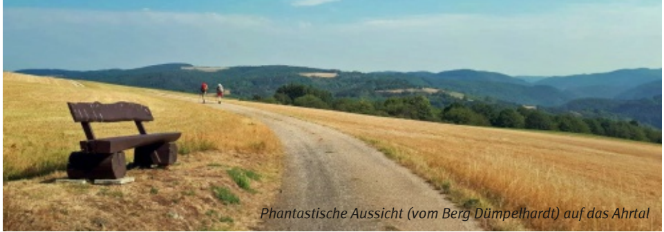
Phantastische Aussicht (vom Berg Dümpelhardt) auf das Ahrtal